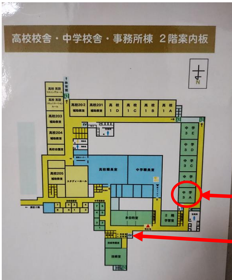
ポリオ友の会東海 会場 中学 3A 教室