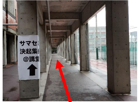
更に奥へ進み 一番奥が高校と中学の校舎への入口