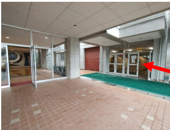
こちらが中学の入口です 右側奥にあるエレベータで 2階へ行きます